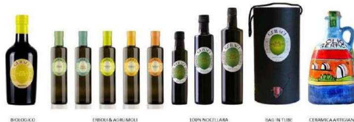
BIOLOGICO ERBOLIO & AGRUMOLIO 100% NOCELLARA BAG IN TUBE CERAMICA ARTIGIANALE